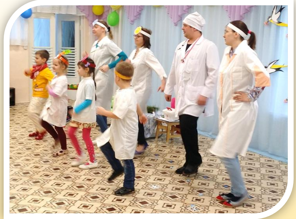
Т еатрализованное представление « Лучшие в мире доктора - Солнце, воздух и вода! » (с родителями) 28.03.2019г.