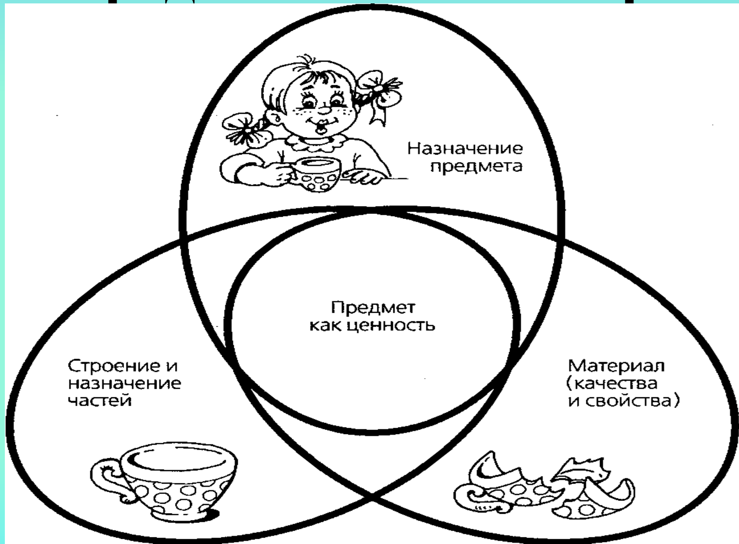
Рис. 2. Модель системного характера представлений о предмете